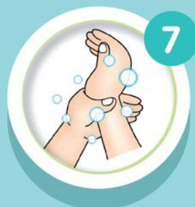
ถูรอบข้อมือ