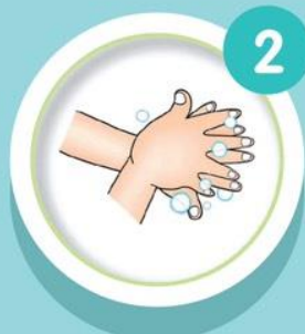
ถูหลังมือ-ซอกนิ้ว