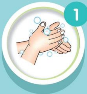
ถูฝ่ามือ