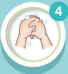
หลังนิ้วมือ ถูฝ่ามือ