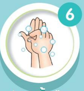
ปลายนิ้วมือ ถูข้างฝ่ามือ