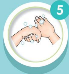
ถูนิ้วหัวแม่มือ โดยรอบด้วยฝ่ามือ