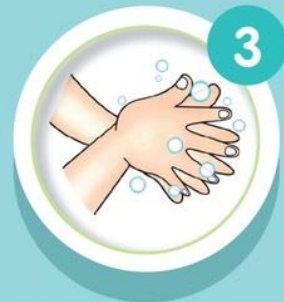
ฝ่ามือถู ฝ่ามือ และนิ้วถูซอกนิ้ว